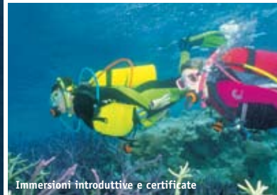
Immersioni introduttive e certificate