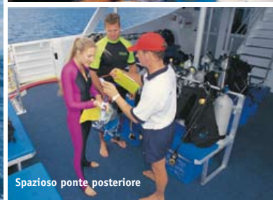
Spazioso ponte posteriore