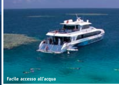
Facile accesso all'acqua