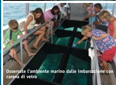
Osservate l'ambiente marino dalle imbarcazione con carena di vetro