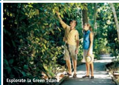
Esplorate la Green Island