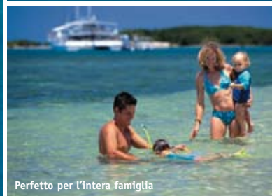
Perfetto per l'intera famiglia