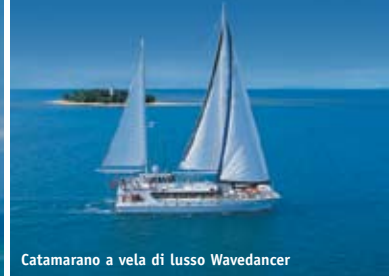
Catamarano a vela di lusso Wavedancer