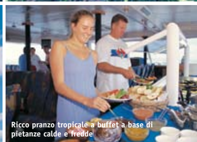
Ricco pranzo tropicale a buffet a base di pietanze calde e fredde